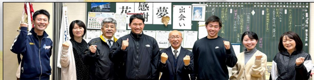
二人が所属していた「青春」学年の担任団